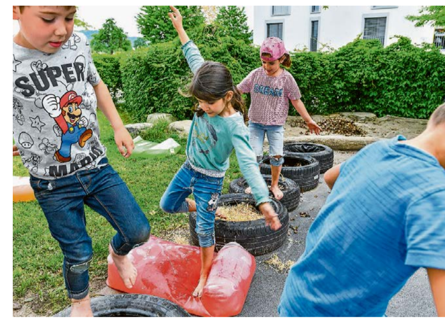
Barfuss verschiedene Materialien spüren oder ausgiebig bauen und ausprobieren: In den Bildungsangeboten wird spielerisch gelernt.