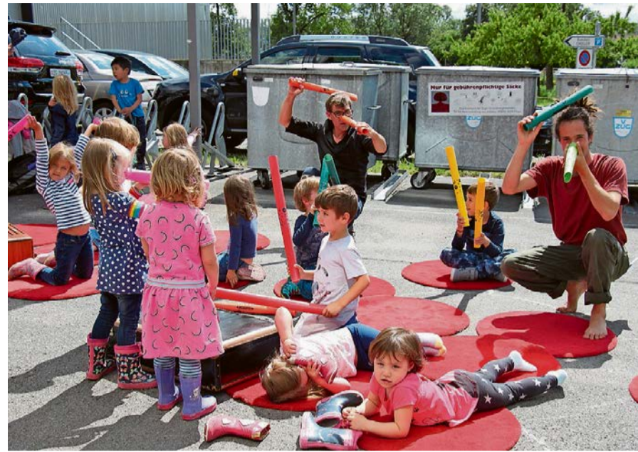
Für das Klangspektakel haben die 60 KiBiZ-Kids im Atelier Badabum viel geübt. Die Vorfreude ist bei den Kindern gross. Am Samstag treten sie endlich vor Publikum auf.